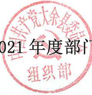
收入支出决算总表