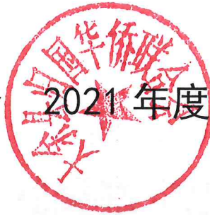
收入支出决算总表