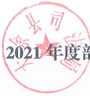
收入支出决算总表