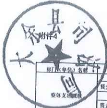
部门整体支出绩效自评表 (2021年度)