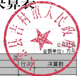
收入支出决算总表