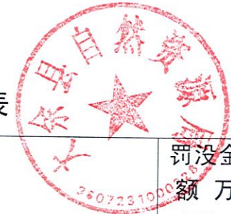
大余县自然资源局 2022 年度行政处罚实施情况统计表