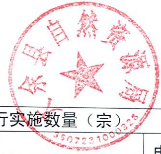
大余县自然资源局 2022 年度行政强制实施情况统计表