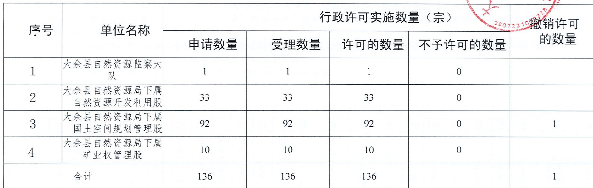
大余县自然资源局 2022 年度行政许可实施情况统计表