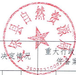
大余县自然资源局 2022 年度行政执法总体情况统计表