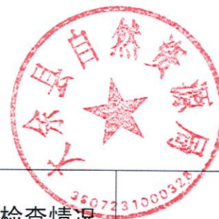
大余县自然资源局 2022 年度行政检查实施情况统计表